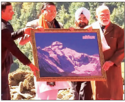
उत्तराखंड के सीएम पुष्कर सिंह धामी प्रधानमंत्री नरेंद्र मोदी को स्मृति चिन्ह भेंट करते हुए।